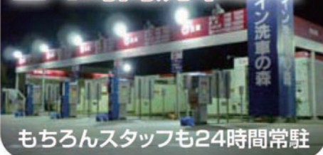
もちろんスタッフも24時間常駐