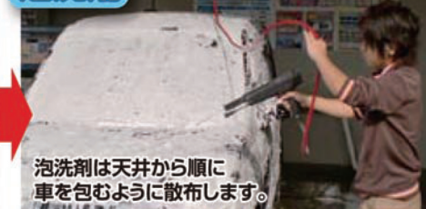
泡洗剤は天井から順に車を包むように散布します。