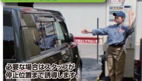
必要な場合はスタッフが停止位置まで誘導します。