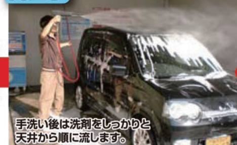
手洗後は洗剤をしっかりと天井から順に流します。