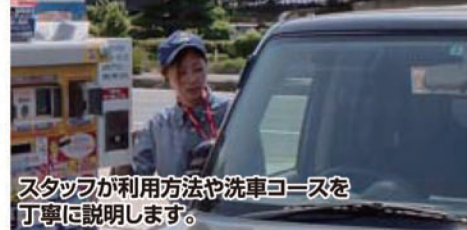
スタッフが利用方法や洗車コースを丁寧に説明します。