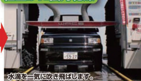
水滴を一気に吹き飛ばします。