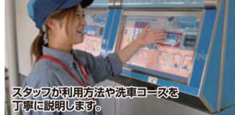
スタッフが利用方法や洗車コースを丁寧に説明します。