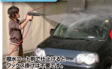
撥水コート剤で仕上げるとワックス掛けは不要です。