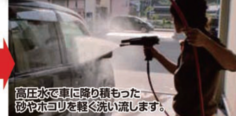
高压水で車に降り積もった砂やホコリを軽く洗い流します。