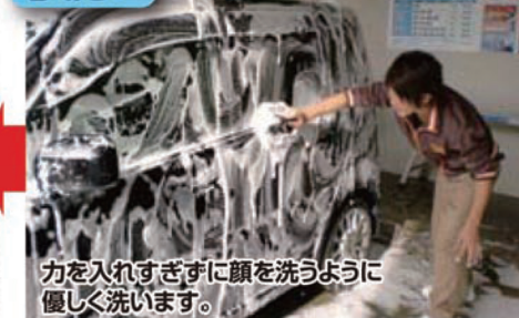
力を入れすぎずに顔を洗うように優しく洗います。