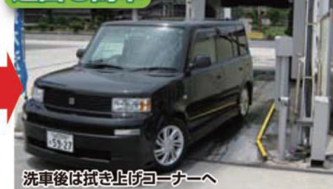
洗車後は拭き上げコーナーへ