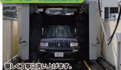
優しく丁寧に洗い上げます。